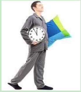
Avoir une durée de sommeil régulière

Qualité Sommeil Hygiène de vie Repas du soir léger Régularité Se coucher à heure fixe et avant minuit (22H -> 24H)